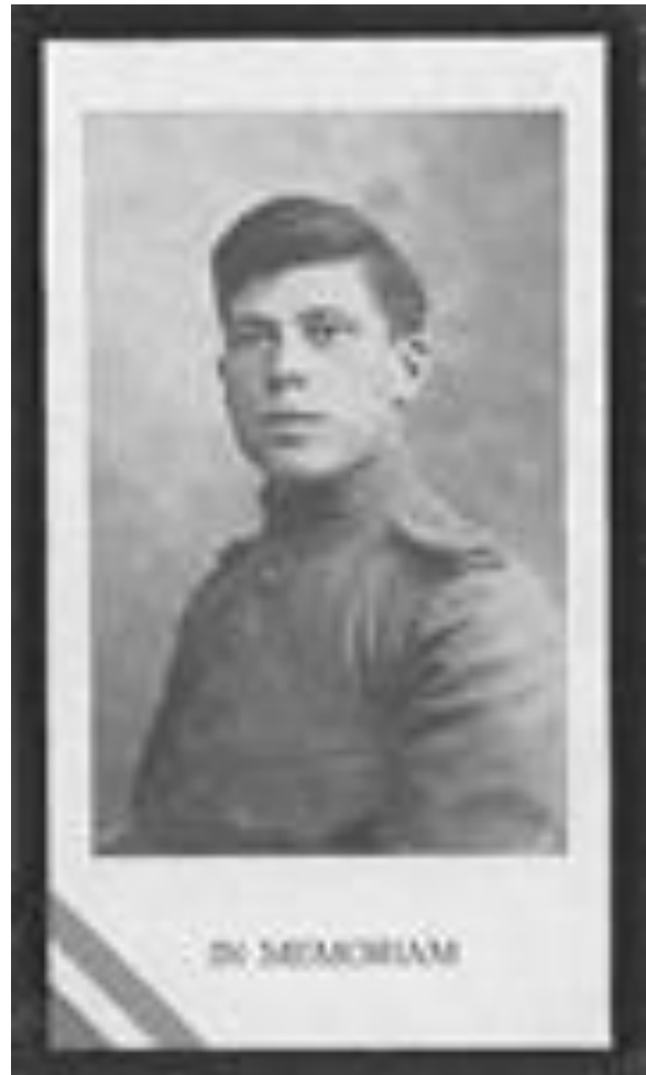
Gesneuveld op 13 mei 1940 Jaarlijks herdacht op 4 mei

Im wunderschönen Monat Mai, Als alle Knospen sprangen, Da ist in meinem Herzen Die Liebe aufgegangen Im wunderschönen Monat Mai, Als alle Vögel sangen, Da hab' ich ihr gestanden Mein Sehnen und Verlangen.