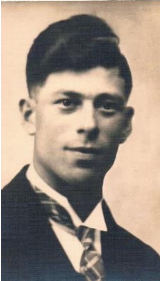
Geboren op 5 mei 1909 Getrouwd op 12 mei 1936